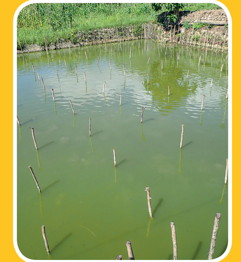
Tau au iha tanki laran bele halo aihan periphyton (mikro organism) atu moris nebe fontes diak husi aihan natural ba nila.

Kombinasau husi aihan no teknolojia bee matak hadia efisiencia fohan.