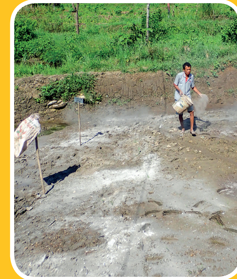
Tau ahua ba tanki ikan