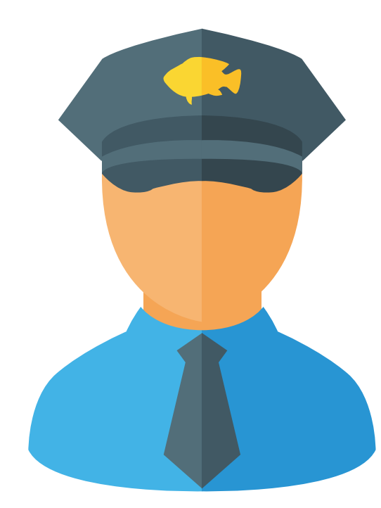
Fo hatene ita nia ofisial Pescas lokal no aquakultor seluk