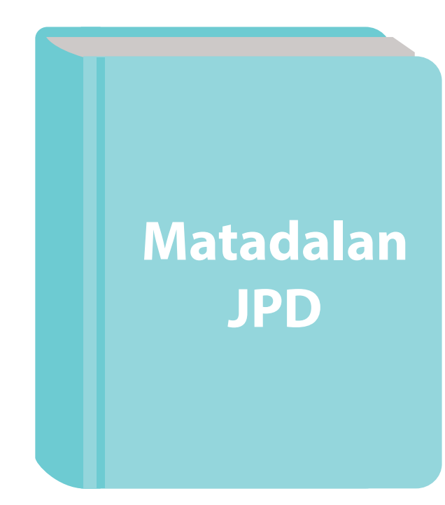
Hare ba matadalan JPD ba Hakiak Nila iha Timor-Leste