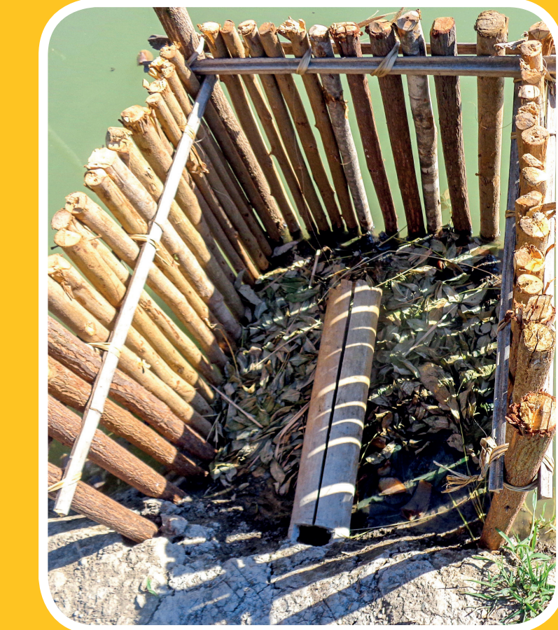
Aumenta animal teen no adubus halo bee matak.